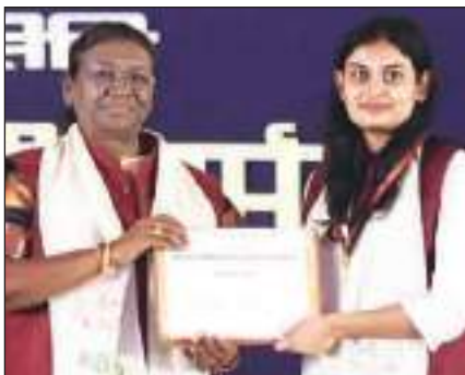
राष्ट्रपति द्रौपदी मुर्मू ने गोविंद बल्लभ पंत कृषि विश्वविद्यालय, पंतनगर के 35वें दीक्षांत समारोह में बतौर मुख्य अतिथि शामिल हुईं।